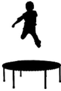
Joue au trampoline