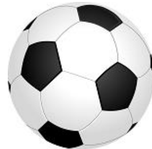
Joue au ballon