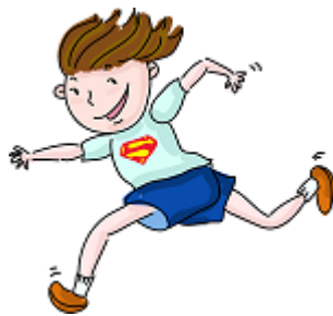
Cours 2 fois autour de la maison