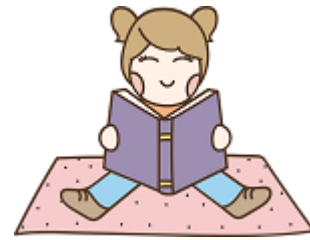
Lis un livre