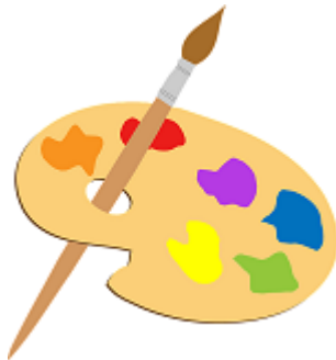
Fais de la peinture